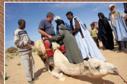
D'UNE MONTURE À L'AUTRE