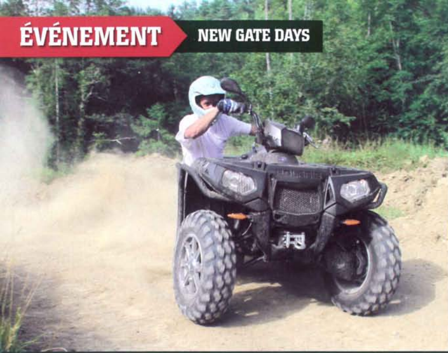
Tous les essais se faisaient par petit groupes encadré par un pilote généreux et son Sportsman... A priori, fallait suivre le rythme. Aucun accident durant deux jours !