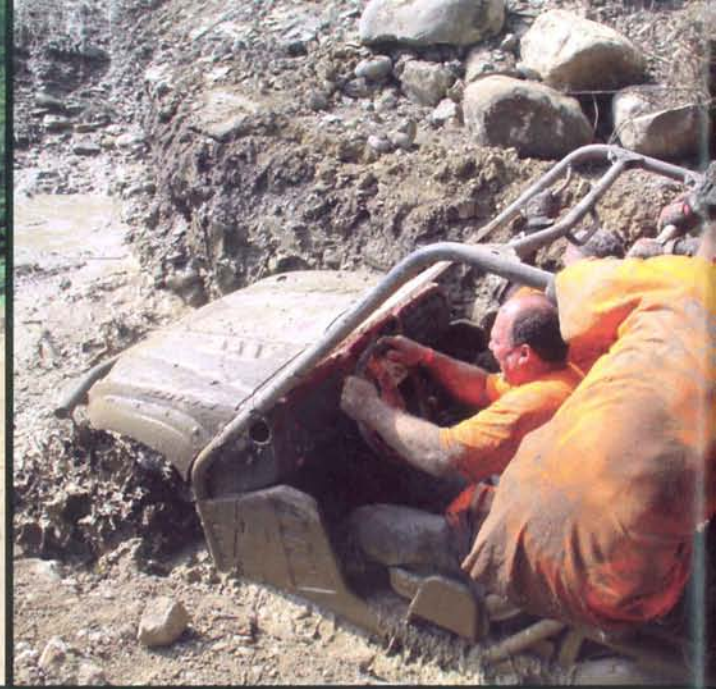
Le Quad Racing team, grand écumeur de randonnées de toute sorte, se devait d'afficher à son palmarès le borbier en Rhino, c'est chose faite, mais à plusieurs !

lants, parfois techniques voire boueux, mais dans tous les cas franchissables même en 2 roues motrices. De toute façon pas de souci, la solidarité est bien présente. Pour le repas de midi, tous les participants étaient attendus dans le village d'Evire où un repas des plus copieux les attendait dans une ambiance « country », oubliez les casse-croûte, ici dans la Hiaute, on sait recevoir ! Le temps de boire un café et la balade continuera jusqu'en fin d'après-midi. Une journée bien remplie, 8 heures par monts et par vaux ! Belle récompense pour des gens parfois venus de loin ! Ici au moins on roule... Mais la journée n'est pas finie, puisque sitôt arrivé, quad nettoyé, le comité des fêtes de Marlioz « ouvrait son service » en accueillant tout ce petit monde (800 repas dans la soirée !) sous les chapiteaux idéalement situés dans les prairies au pied du château. À 23 heures le feu d'artifice agrémentant un son et lumière, dont la trame, l'histoire du village, terminait cette superbe journée. La randonnée du dimanche, plus courte, accueillera 53 équipages, dont beaucoup étaient d'ailleurs en duo. Cette boucle réalisée dans les mêmes conditions que celle de la veille, se voulait