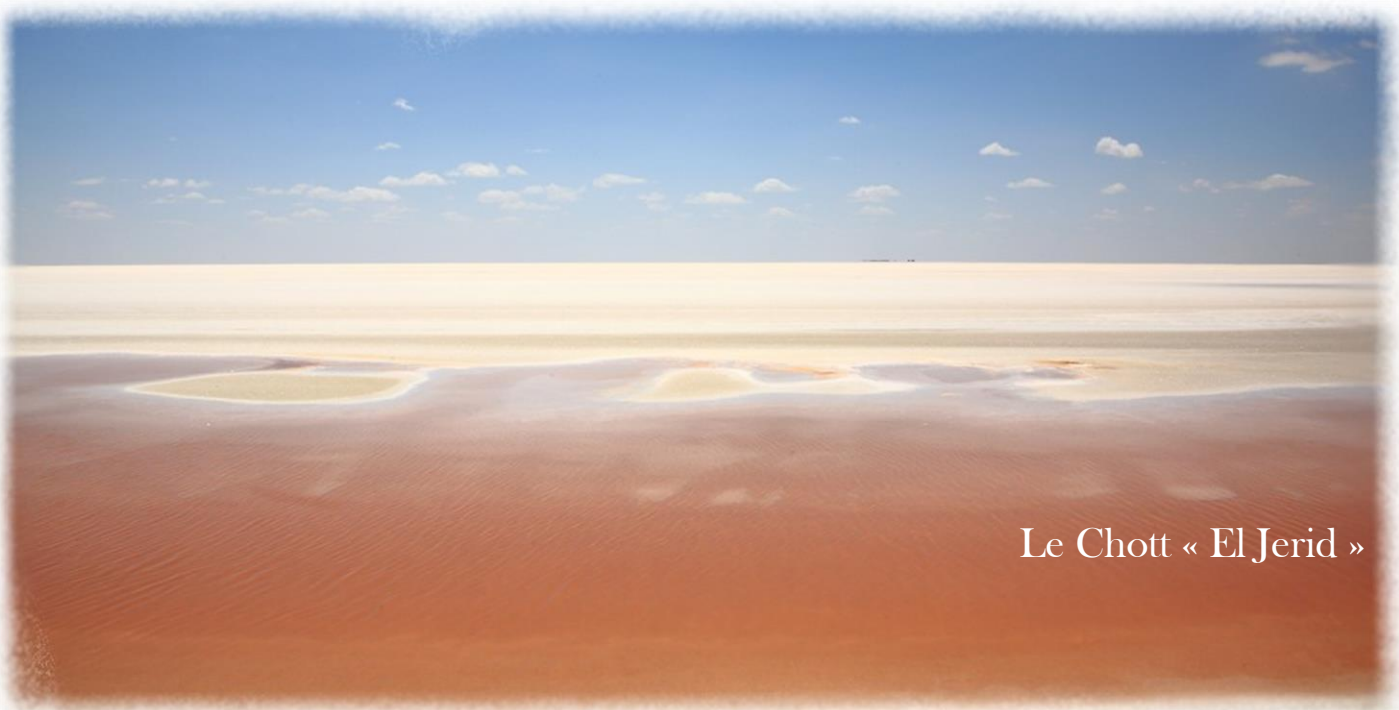
Le Chott « El Jerid »