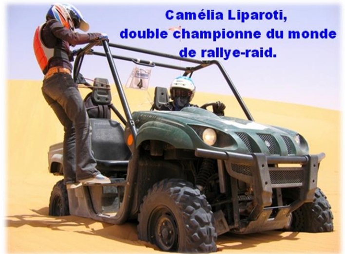
Camélia Liparoti, double championne du monde de rallye-raid.

Jour 4 : mardi Les organismes commencent à être fatigués à force d'escalader et de surfer les dunes et nombreux sont ceux qui font appel à l'ostéopathe de l'organisation pour les remettre d'aplomb. Après un bon massage et un solide petit déjeuner, la fatigue disparaît pour laisser place à l'envie. Le parcours reprend en direction de la Vallée des Merveilles. On remonte sur la gauche un affluent en direction du petit village de Timinit. L'oued est peuplé et les nomades-éleveurs habitent dans de petites cases circulaires adossées aux flancs de la montagne . Sur la gauche de l'oued, un nouvel erg, avec des dizaines de dunes