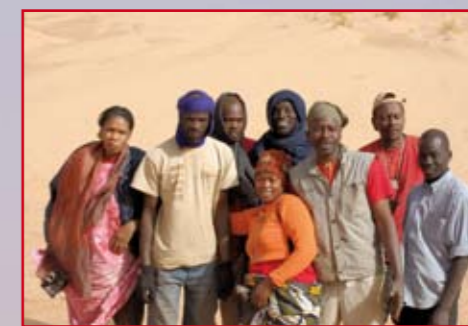
Une équipe de choc, prête à tout pour notre plus grand plaisir. Un grand merci à tous !