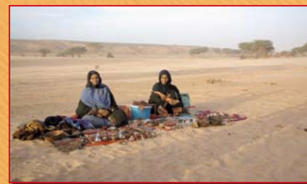
Boutique mauritanienne où l'accueil est exceptionnel et très chaleureux...